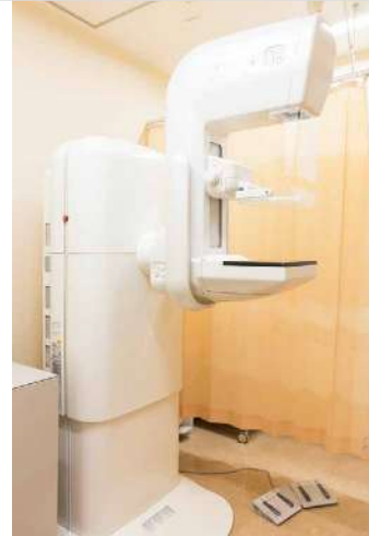
マンモグラフィ検査施設・画像認定施設