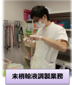
末梢輸液調製業務