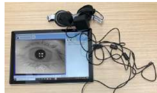
ポータブル眼球運動撮影装置