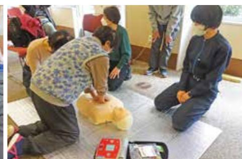
▲AED・心肺蘇生法講習会