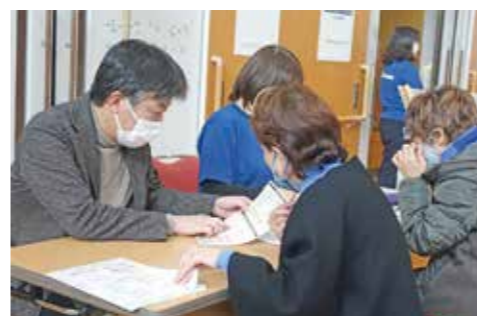
▲人間ドック・健診のご案内